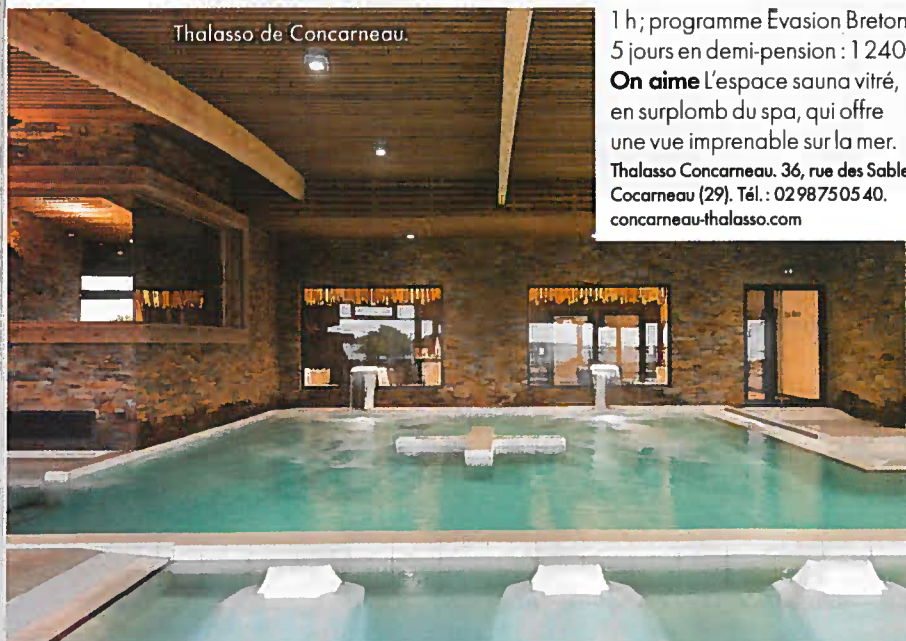
Thalasso de Concarneau.

Belle en Soie. 10, rue du Général-De-Gaulle, Combrit Sainte-Marine (29). Tél. : 02 98 66 10 36. institut-belle-en-soie.fr