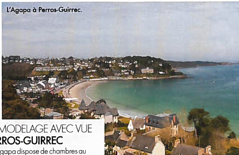
L'Agapa à Perros-Guirrec.